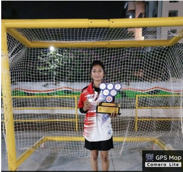
Sr. No. 107, Emirus Society, Near, Balewadi High St, behind D-mart, Laxman Nagar, Baner, Pune, Maharashtra 411045, India Latitude 18.56774299° Longitude 73.77044181° Local 07:26:37 PM Altitude 14.02 meters GMT 01:56:37 PM Tuesday, 29.11.2022