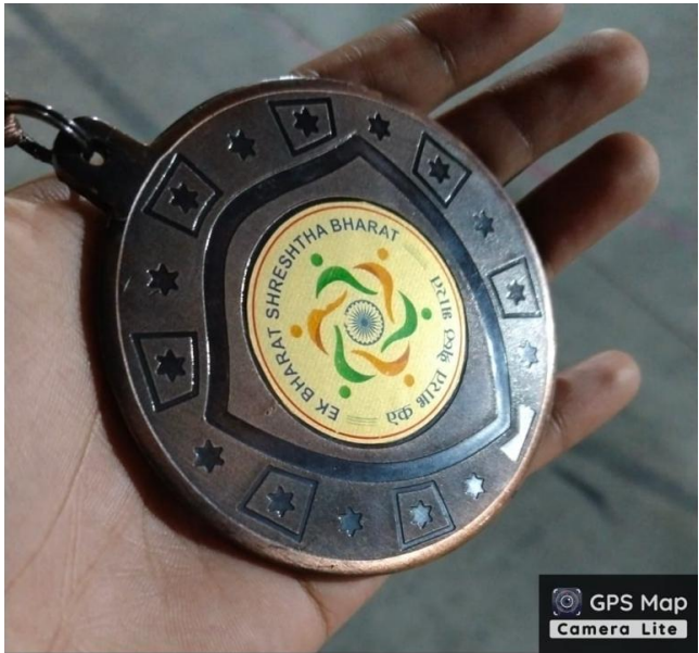
Row house no B 12, Gulmohar Residency, near Karnataka Bank Baner Branch, Laxman Nagar, Baner, Pune, Maharashtra 411045, India Latitude 18.56747024° Longitude 73.77041375° Local 07:53:23 PM Altitude 14.02 meters GMT 02:23:23 PM Tuesday, 29.11.2022