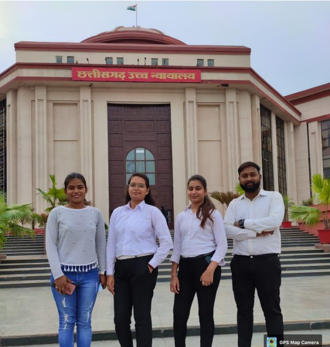
Bodri, Chhattisgarh, India Main road kusaha, 239W+7Q8, Bodri, Chhattisgarh 495220, India Lat 22.018038° Long 82.096967° 29/06/22 04:16 PM