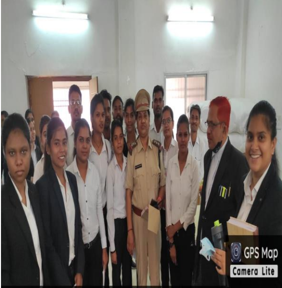
7J2R+HHV, Devendra Nagar, Raipur, Chhattisgarh 492001, India Latitude Longitude 21.2517318° 81.6415081° Local 12:39:35 PM Altitude 234 meters GMT 07:09:35 AM Wednesday, 15-06-2022