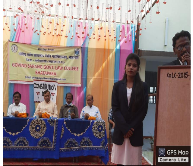
Bhatapara Rd, Deori, Chhattisgarh 493118, India

Latitude 21.76486979238689° Longitude 81.93588679656386° Local 12:26:39 PM Altitude 217 meters GMT 06:56:39 AM Friday, 26-11-2021