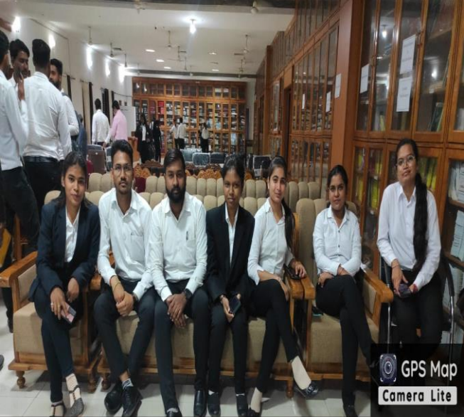
35G8+H5W, Tikrapara, Bilaspur, Chhattisgarh 495001, India Latitude Longitude 22.0759869° 82.1649535° Local 05:01:43 PM Altitude 206.1 meters GMT 11:31:43 AM Tuesday, 28-06-2022