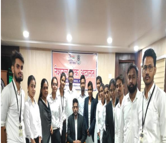
6JVV+J47, Civil Lines, Raipur, Chhattisgarh 492001, India Latitude Longitude 21.2465391° 81.6426562° Local 03:08:14 PM Altitude 239.3 meters GMT 09:38:14 AM Friday, 10-06-2022