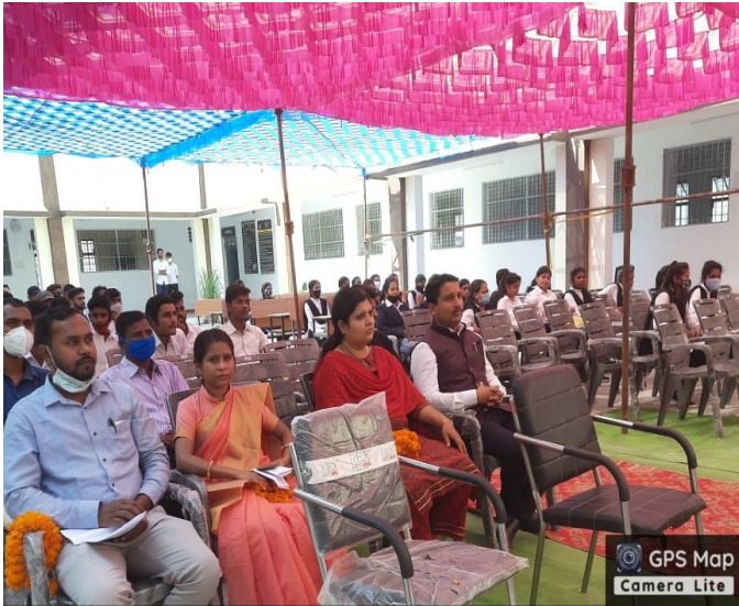
Bhatapara Rd, Deori, Chhattisgarh 493118, India

Latitude 21.76486979238689° Longitude 81.93588679656386° Local 12:26:39 PM Altitude 217 meters GMT 06:56:39 AM Friday, 26-11-2021