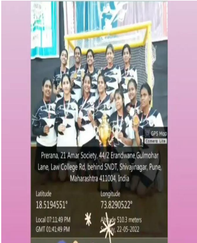
Prerana, 21 Amar Society, 44/2 Erandwane, Gulmohar Lane, Law College Rd, behind SNDT, Shivajinagar, Pune, Maharashtra 411004, India Latitude 18.5194551° Longitude 73.8290522° Local 07:11:49 PM Altitude 510.3 meters GMT 01:41:49 PM Sunday, 22-05-2022