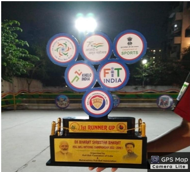
B -12, Gulmohar Residency, S. no: 106/1/9, Laxman Nagar Behind Dmart, Near Karnataka Bank, Laxman Nagar, Baner, Pune, Maharashtra 411045, India Latitude 18.56769852° Longitude 73.77038365° Local 07:31:28 PM Altitude 14.02 meters GMT 02:01:28 PM Tuesday, 29.11.2022