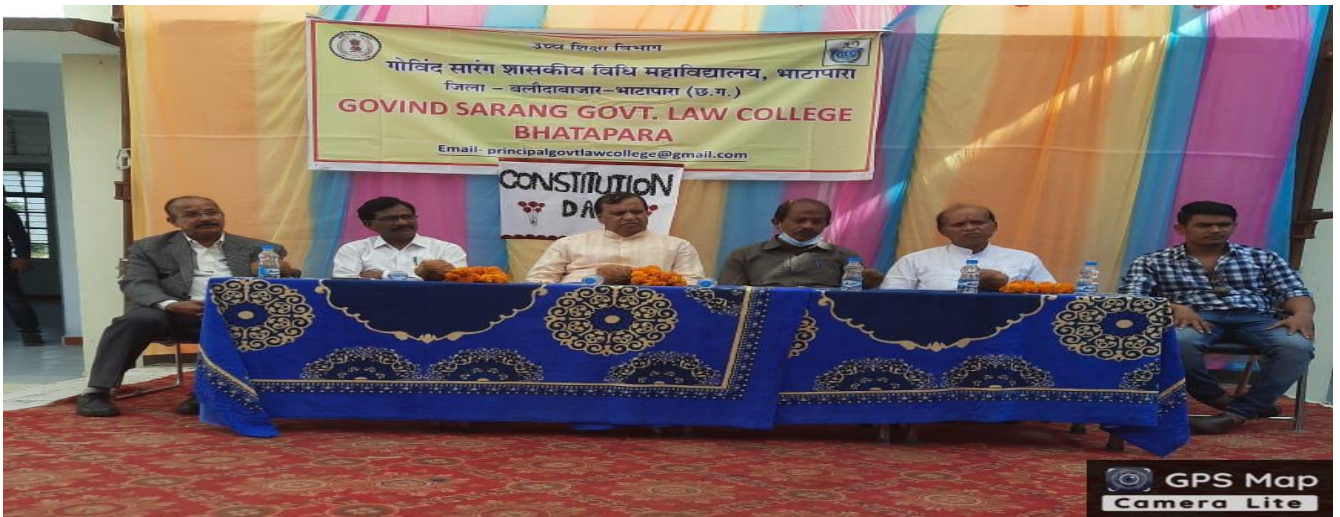
Bhatapara Rd, Deori, Chhattisgarh 493118, India

Latitude 21.764922975562513° Longitude 81.93586357869208° Local 12:25:53 PM Altitude 207 meters GMT 06:55:53 AM Friday, 26-11-2021